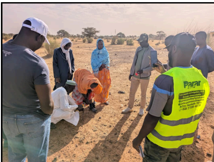
Sous Projet FEGINA