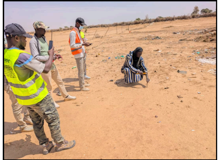
Sous Projet Ndianga EDY