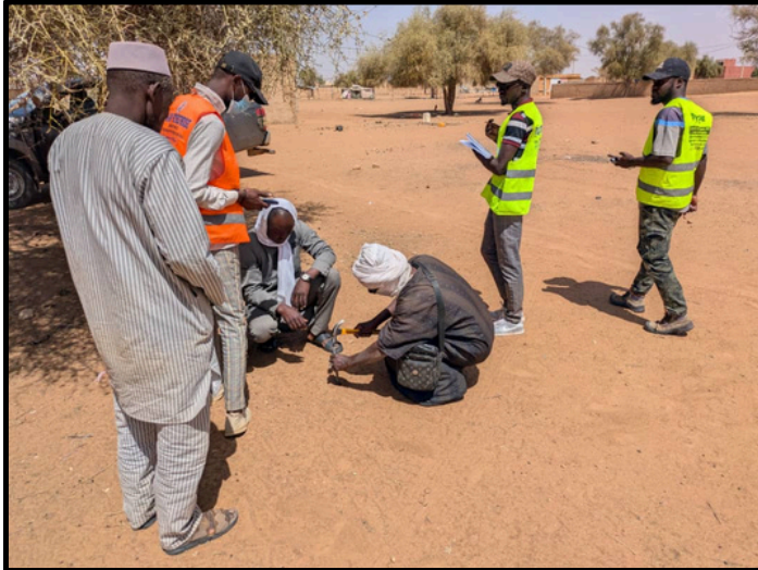
Sous Projet Touldé GALE