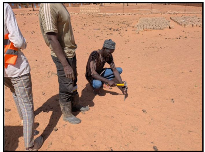
Sous Projet DODEL