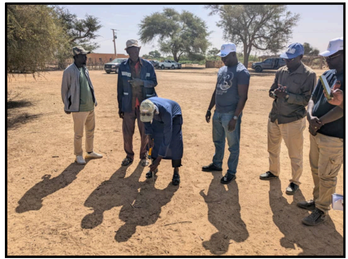
Sous Projet Juddiba ANNIYA (Diarra)