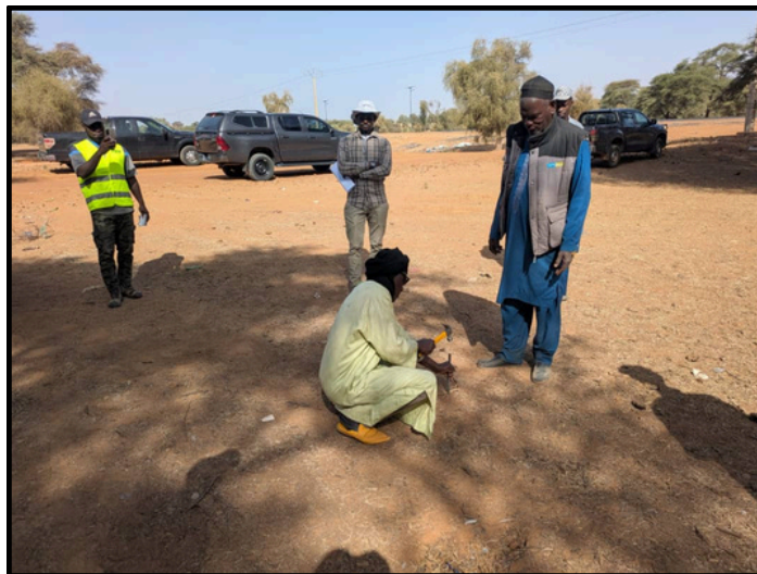
Sous Projet Gamadji Sarre